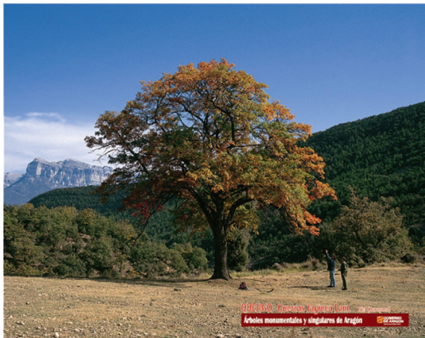
Figura 1. Publicación y cartelería basada en el Inventario Abierto de los Árboles Singulares de Aragón